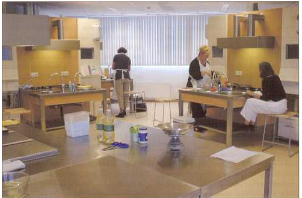
Twee consumenten aan het werk in Culinary

Een andere techniek is 'Contextual Inquiry' (Holzblatt and Beyer, 1993). Bij deze techniek wordt de eindgebruiker thuis uitgebreid geïnterviewd door een lid van het ontwikkelteam tijdens de uitvoering van een concrete taak. De interviewer kan op ieder moment inhaken en vragen